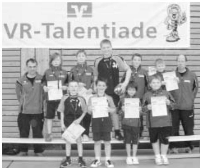
Unsere erfolgreiche E4 +1

Ganz herzlich möchte ich mich auch bei allen Eltern und Helfern bedanken die kurzfristig eingesprungen sind und uns an dem Spieltag, mit fast 60 Kindern und fast 100 Zuschauer, tatkräftig unterstützt haben.