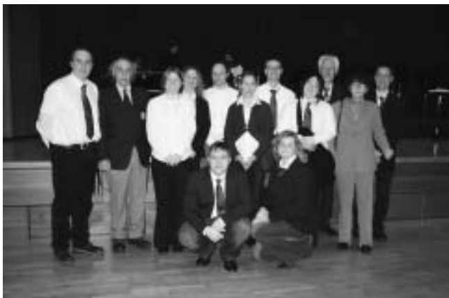
Die 13 DRK-Helfer/Innen beim Empfang im Bürgerzentrum Waiblingen

Im Anschluss hatten alle Gäste am kleinen Büfett die Gelegenheit sich in Gesprächen zu erinnern und auszutauschen. Musikalisch umrahmt wurde der Abend durch die Big Band des Max-Planck-Gymnasiums Schorndorf.