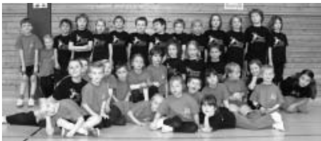
Alle teilnehmenden Minis der HSK, Gruppe Urbach und Plüderhausen

Im Mini-Bereich wird außerdem noch ohne Wertung gespielt, so dass sich am Ende alle Kinder als Sieger fühlen konnten und mit einer Goldmedaille im Gepäck nach Hause fuhren. Die reibungslose Durchführung des Spielfestes und die Bewirtung der zahlreichen Zuschauer wäre (erneut) ohne die Urbacher Eltern nicht möglich gewesen. Ein besonderes herzliches Dankeschön gilt daher den Eltern unserer Mini-Gruppe. Ein weiterer Dank gilt den Betreuerinnen der Urbacher Minis, den Schiedsrichtern, unserer Kioskverantwortlichen sowie Hausmeister Jordan für das tatkräftige Engagement. Auch für die Sachspenden durch die Firmen McDonalds und Coca-Cola Urbach ein herzliches Dankeschön.