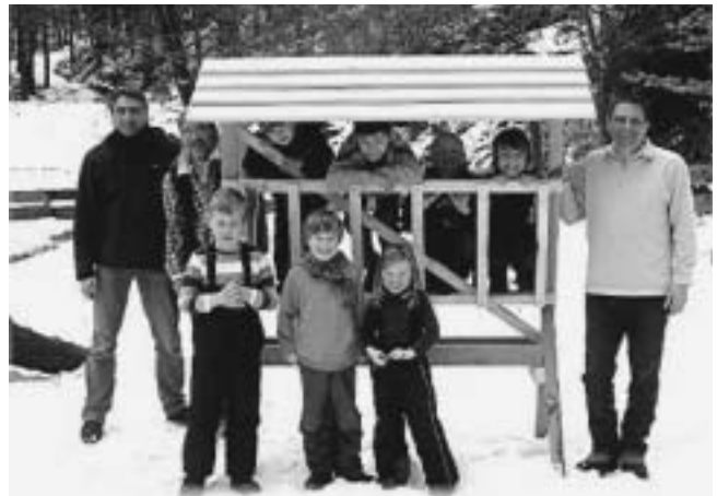
Das Meisterstück ist gelungen - die Mitarbeiter freuen sich

Am 21. Februar war es mal wieder so weit. Fuchs & Co waren aktiv. Unser mittlerweile fester „Stamm“ hat die Futterkrippe fertig gebaut. Unter fachkundiger Leitung der Väter und unseres Teams schraubten und sägten die Jungfuchse was das Zeug hielt. Alle Beteiligte hatten viel Spaß und das Ergebnis kann sich absolut sehen lassen. Yes, wie can! Drinnen, in der warmen Hütte, wurde gebastelt und gemalt, gespielt und gelacht. Von 3 bis 67 Jahre - alle hatten einen tollen Nachmittag in und um unsere schön verschneite Reihaldenhütte, ob bei der Schneeballschlacht, mit Albvereinshund „Indi“ durch den Schnee toben oder Stockbrot am Lagerfeuer backen. Am 21. März geht's weiter mit Basteln für Ostern, aus Salzteig und Gips. Die Futterkrippe muss aufgestellt werden und und und. Langweilig wird's nicht. Wir freuen uns schon! Euer Team von Fuch & Co.