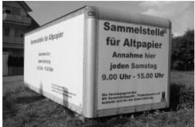
Altpapiercontainer Ecke Hohenstaufer-/Rosenstraße

Jeden Samstag von 9.00h bis 15.00h hat unsere Sammelstelle für Altpapier, unser Altpapiercontainer, an der Ecke Hohenstauferstraße/Rosenstraße geöffnet. Dort können Sie zweckgebunden für unsere Jugendarbeit Altpapier abgeben. Wir freuen uns über Ihre Spende.