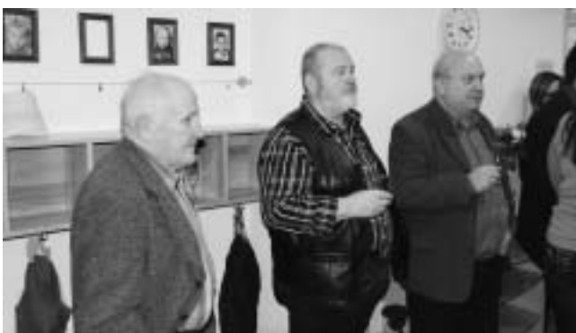
Lob gab es auch für die Akteure vom Seniorennetzwerk, die beim Einzug tatkräftig im Einsatz waren.

Am Sonntag, 2. Mai 2010, wenn auch die Außenanlagen fertiggestellt sind, wird die Öffentlichkeit Gelegenheit haben, bei einem „Tag der offenen Tür“ das Kinderhaus Goldacker zu besichtigen.