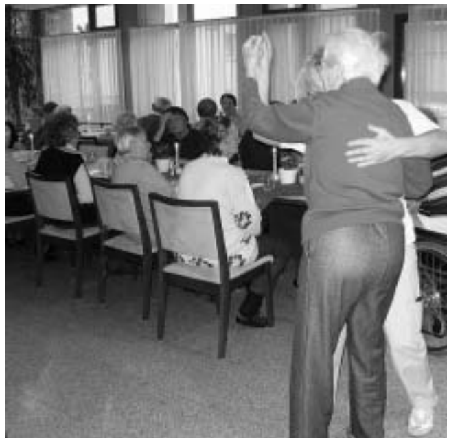
Kaffee, Kuchen und ein kleines Tänzchen...

Der nächste Spielenachmittag für die Bewohner des betreuten Wohnens findet am Donnerstag, 28. Januar 2010 statt in der Zeit von 15.30 bis 17.00 Uhr.