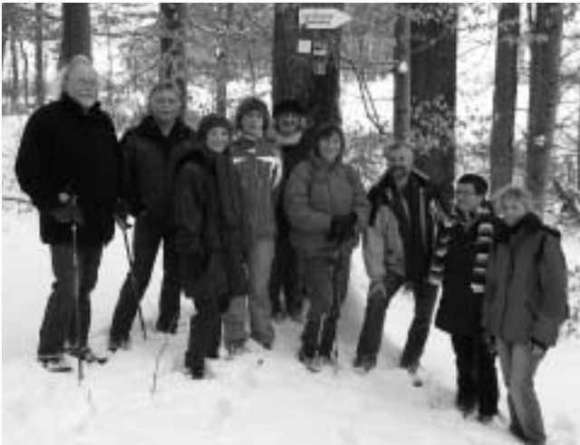
Die Jubiläumswanderer unter der Tafel „Jubiläumswanderweg“

Zur Jubiläums-Jahresanfangs-Winterwanderung machte sich eine zwar übersichtliche, jedoch gut gelaunte Schar wanderfreudiger Teilnehmer auf. Bei winterlich klassisch schönem Wetter ging die Tour von Rudersberg über Klaffenbach auf die windgepeitschte, aber sonnige Haube (immerhin über 500 m hoch gelegen), danach über verschlungene und verwunschene, vor allem aber verschneite Waldwege zurück nach Rudersberg. Nach vier Stunden Stapfen im Schnee folgte dann bei schwindendem Tageslicht die wohlverdiente Einkehr, und erst lange nach Einbruch völliger Dunkelheit die Heimkehr.