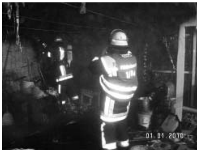
Aufspüren von Glutnestern mit Hilfe der Wärmebildkamera

Nacht 28 Einsatzkräfte (inkl. der in Bereitschaft versetzten Kräfte) der Feuerwehr Plüderhausen mit 2 Fahrzeugen.