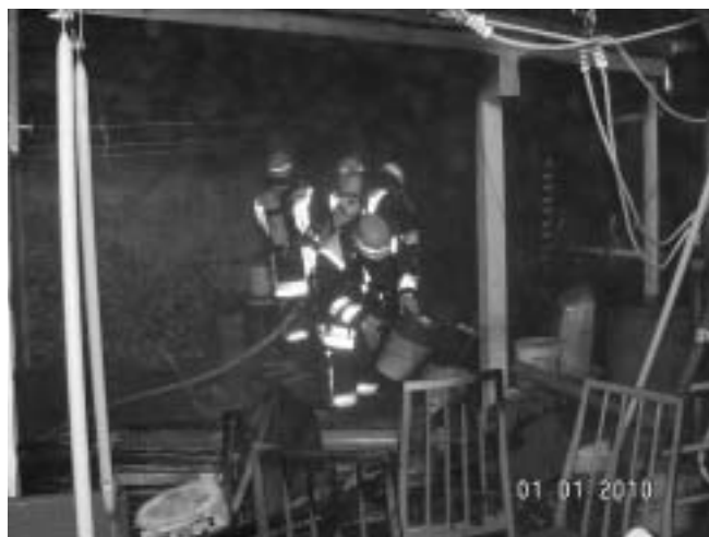
Herausbringen und Ablöschen der Gegenstände unter Atemschutz

Die Freiwillige Feuerwehr Plüderhausen wünscht an dieser Stelle allen Mitbürgern der Gemeinde Plüderhausen ein frohes, gesundes sowie erfolgreiches, neues Jahr 2010.